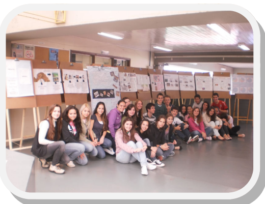
Um dos murais que concorrem ao prêmio

FETRACONSPAR, SINTRIVEL e NRE promovem um Concurso de Mural para os estudantes da rede estadual de ensino de Cascavel.